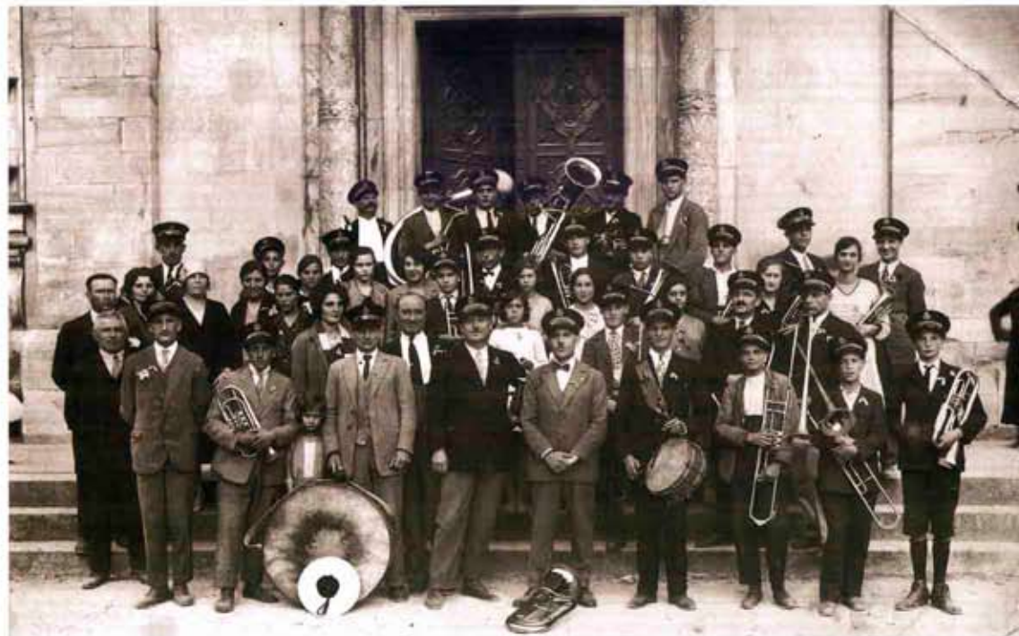
La "Banda Madonna di Tirano" il 29 settembre 1928, anniversario dell'Apparizione.