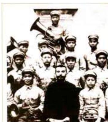
DON CARLO BRAGA Tirano 1889 - Manila, Filippine 1971

Allievo del Collegio Salesiano di Sondrio, consegue la maturità classica nel liceo-ginnasio del capoluogo valtellinese. Durante la permanenza nel collegio frequenta la scuola di musica della banda dell'Oratorio San Rocco della quale entra a far parte come suonatore di trombone. Viene accolto nella congregazione di San Giovanni Bosco e intraprende gli studi che lo porteranno all'ordinazione sacerdotale nel 1914. Partecipa alla guerra 1915-18 come "soldato di sanità" raggiungendo il grado di sergente. Consegue l'abilitazione magistrale e alla direzione didattica prima di partire missionario in Cina, a 32 anni, tanti quanti vi rimarrà dal 1919 al 1952. Dopo l'espulsione dei missionari dalla Cina si trasferisce nelle Filippine dove rimane dal 1952 alla morte nel 1971. In ambedue i campi di missione ricoprì importanti incarichi nella congregazione salesiana.