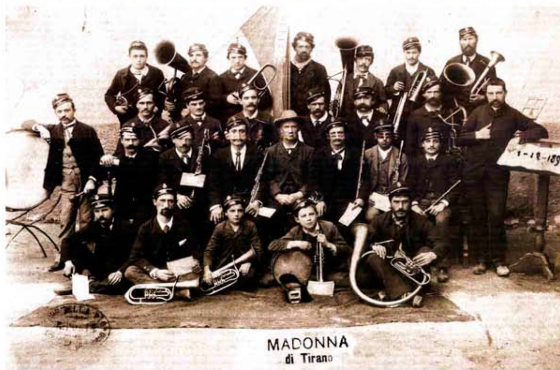
MADONNA di Tirano

La "Società Concordia" di Madonna di Tirano (1894).