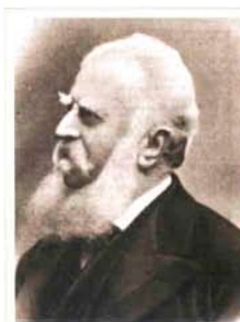
EMILIO VISCONTI VENOSTA Milano 1829 - Roma 1914

Discendente da una delle più illustri famiglie valtellinesi, nacque a Milano, ma rimase sempre legato a Tirano dove per tutta la durata della fanciullezza e gran parte della gioventù trascorse i mesi estivi nel palazzo dove più tardi ebbe sede la Fondazione Camagni per la fanciullezza abbandonata. Protagonista delle Cinque giornate di Milano, Commissario regio al campo del generale Garibaldi divenne uno dei maggiori statisti italiani dal 1862 fino alla vigilia della prima guerra mondiale guidando la politica estera del giovane Regno d'Italia dal 1869 al 1876 e dal 1896 al 1901. Più volte eletto deputato venne nominato senatore e per i suoi grandi meriti fu insignito del titolo nobiliare di marchese. Fu un grande sostenitore della banda e il suo nome compare più volte fra gli offerenti delle varie collette organizzate a sostegno del sodalizio. Tirano lo onorò dedicandogli una via quando ancora era in vita. In tale occasione scrisse al Sindaco: "l'onore che i miei concittadini vollero farmi mi è tanto più caro perché si associa ai ricordi che mi legano al nostro paese". In occasione dei funerali di Tirano la banda Palestrina partecipò al corteo che accompagnò la sua salma dalla stazione alla chiesa degli Angeli Custodi.