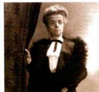
COSMINA FOPPOLI Milano 1849 - Tirano 1913