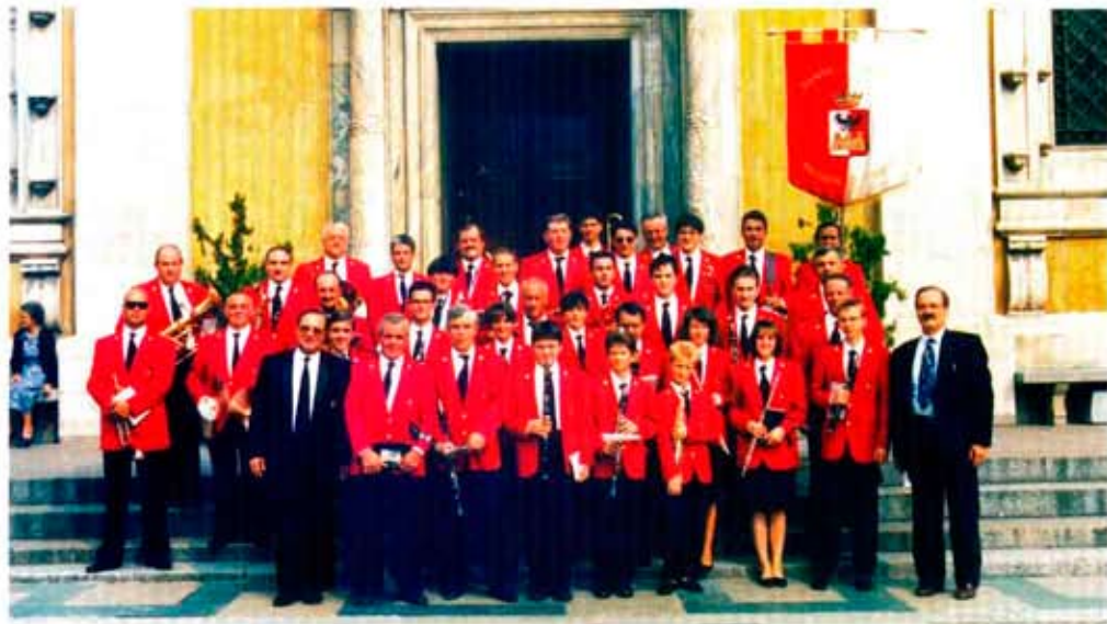
La banda davanti al Santuario in occasione della inaugurazione della nuova divisa nel 1992.