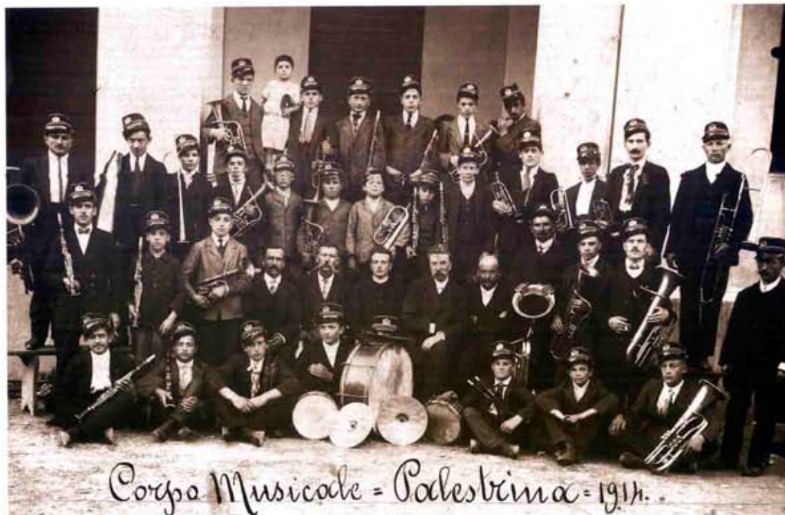
Corpo Musicale = Palestrina = 1914.

La "Banda Palestrina" in una fotografia del 1914.