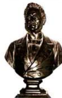
LUIGI TORELLI Vila di Tirano 1810 - Tirano 1887

Il conte Luigi Torelli, patriota tiranese che durante le Cinque Giornate issò il tricolore sul Duomo di Milano, combattente alla battaglia di Novara, più volte deputato, ministro nel Governo piemontese, governatore della Provincia di Sondrio al momento della sua unione all'Italia, senatore del Regno, prefetto di Bergamo, Pisa, Venezia e Palermo, promotore degli Ossari di San Martino e Solferino, sostenitore del taglio dell'istmo di Suez, fu anche direttore della banda musicale a Tirano nel 1844. Ce lo testimonia la lettera conservata nell'archivio comunale di cui riportiamo il testo: