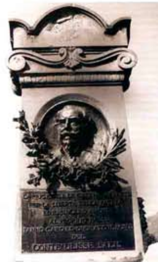
ULISSE SALIS Tirano 1819 - Esine 1893

Il conte Ulisse Salis, mazziniano, combattente durante le Cinque giornate di Milano e allo Stelvio, arrestato come cospiratore nel 1853, recluso a Mantova e, dopo la condanna, nella fortezza di Kufstein, è ricordato con una lapide sulla casa natale di Tirano e in quella che abitò a Milano dove, dopo la liberazione, divenne ingegnere governativo concludendo la carriera come ingegnere capo nel 1891.