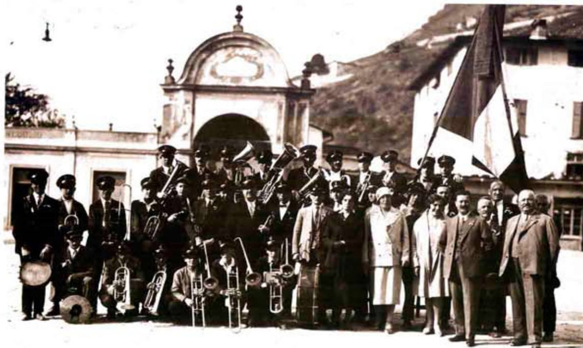
Il "Corpo Musicale Madonna di Tirano" inaugura la bandiera (1929).