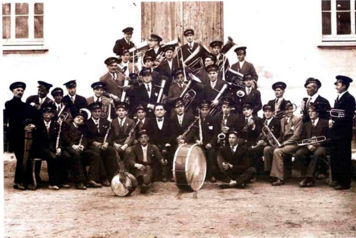
La "Banda Cittadina di Tirano" in una foto del 1935.