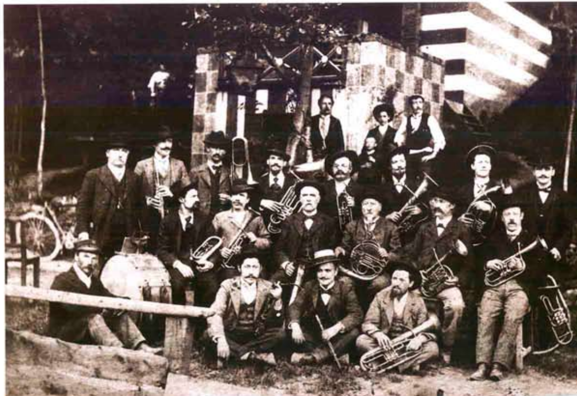
La "Società Filarmonica" di Tirano al Croto dell'Eden (1899).